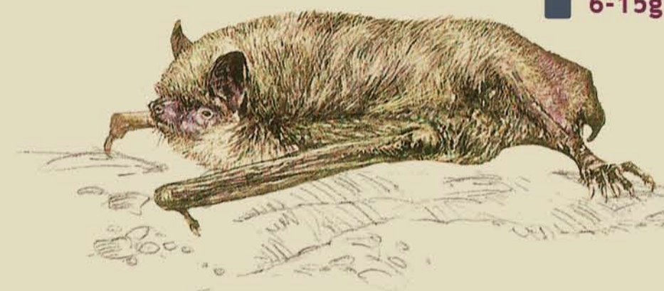
Rata penada peugròs Murciélago ratonero patudo Myotis capaccinii