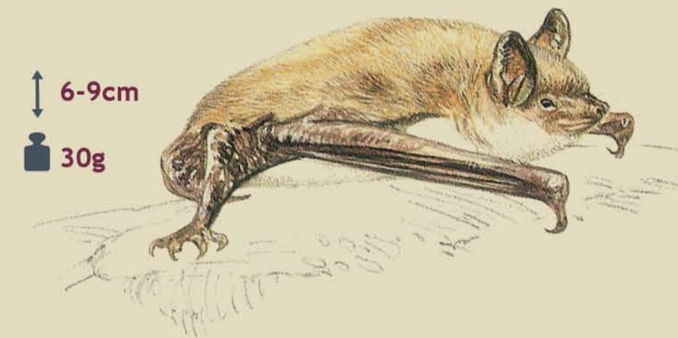
Rata penada ratonera mitjana Murciélago ratonero mediano Myotis blythii