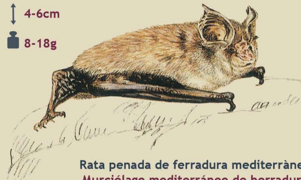
Rata penada de ferradura mediterrànea Murciélago mediterráneo de herradura Rhinolophus euryale