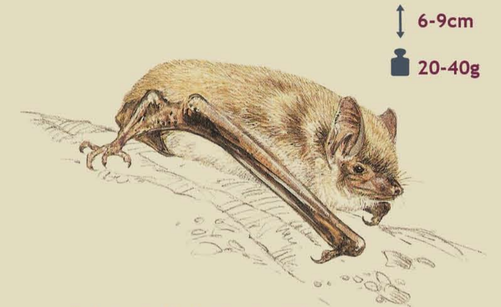
Rata penada de morro grà Murciélago ratonero grande Myotis myotis